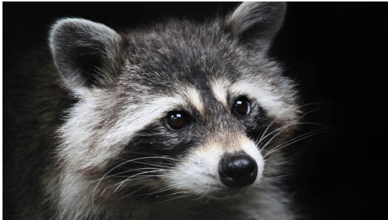
wasbeerspoelworm ( Baylisascaris procyonis )